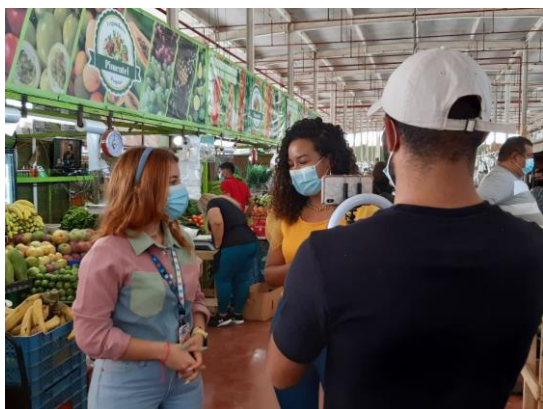
Programa Mujer Nextv Canal 21