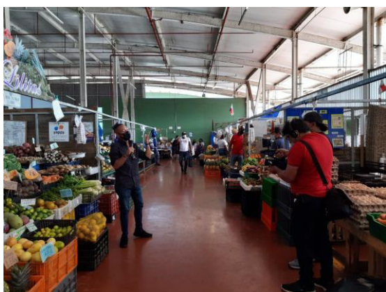
Programa Tu Mañana